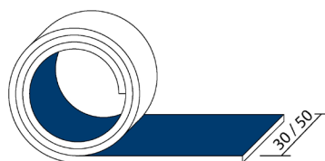
SCHÉMA TECHNIQUE (Cotes en mm)

Nécessite peu d'entretien. Lavage à l'eau et aux détergents classiques avec brosse souple.